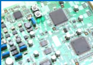
[プリント基板実装]